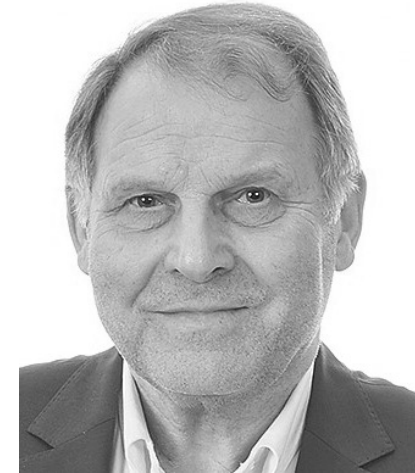
- Dipl.-Ing. (RWTH Aachen) - Zertifizierter Manager für Risiko, Krise, Restrukturierung und Sanierung (HTWD: Hochschule für Technik und Wirtschaft Dresden)